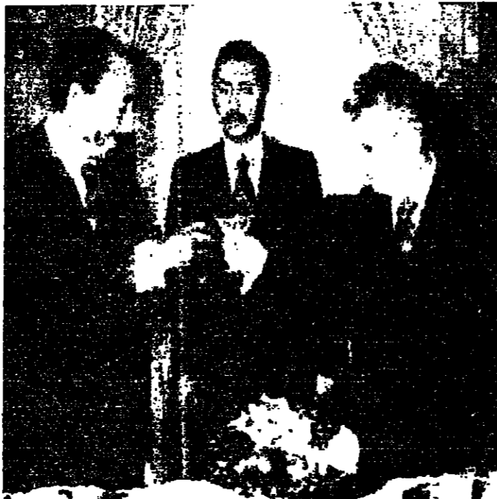
الرئيسان السادات ونشواتينسكو يبادلان التهانئ خلال المقابلة...